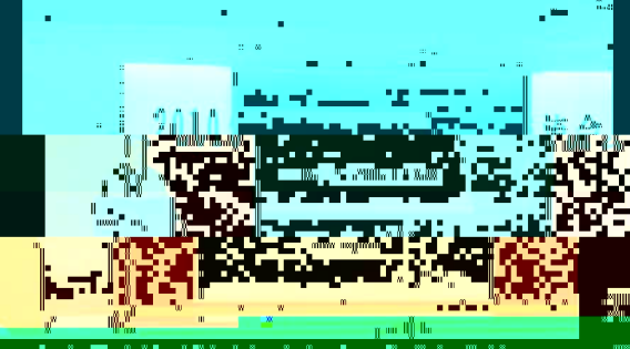
教育学院2010年度学术交流会合影

此次会议主题为“教育发展与创新”，旨在总结过去一年的工作成果，明确未来的发展方向。会上，与会代表围绕人才培养、科学研究、社会服务等方面进行了深入交流。